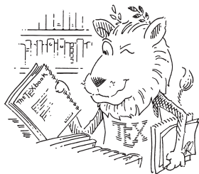
CTAN-Löwe, gezeichnet von Duane Bibby. Vielen Dank an www.ctan.org .

Kontakt: sievers@uni-trier.de martin@dante.de