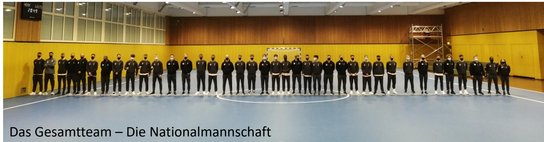
Das Gesamtteam – Die Nationalmannschaft