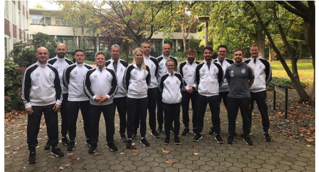
Trainer- und Funktionsteam – „Staff“