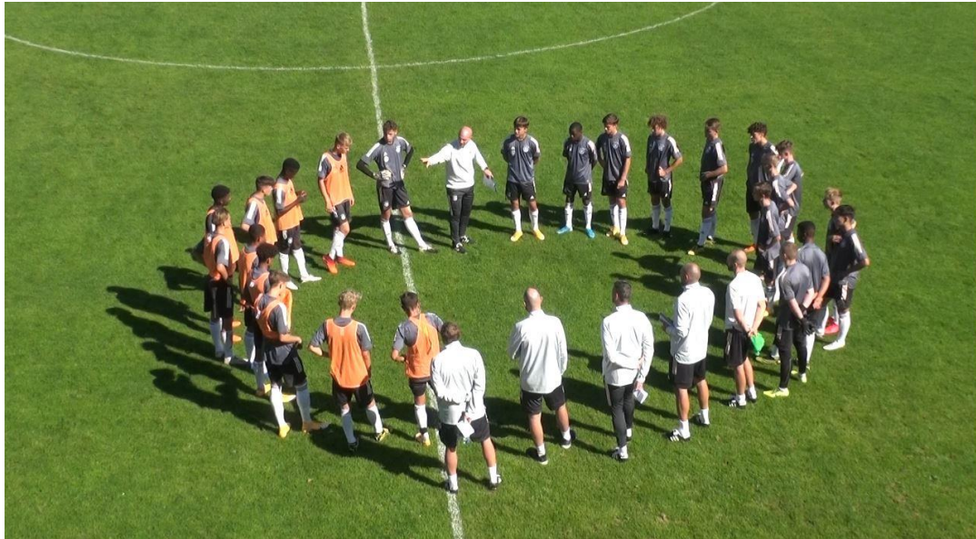
Mannschaft und Trainerteam