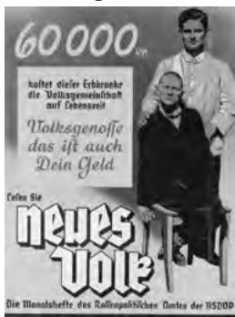
Monatsheft des Rassepolitischen Amtes der NSDAP 1937

ORT: Rathaus Nierstein, Riesling-Galerie, Bildstockstraße 10, 55283 Nierstein