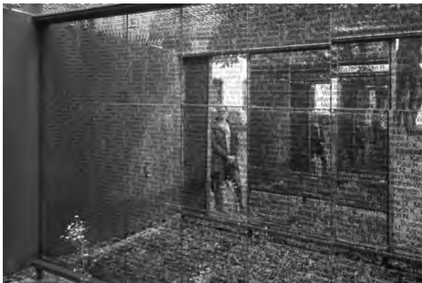
Andernacher Spiegelcontainer

ORT: Rhein-Mosel-Fachklinik Andernach, Klinikkirche St. Thomas und Andernacher Spiegelcontainer an der Christuskirche