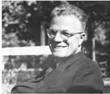
Alfred Delp

Der 1907 in Mannheim geborene und in Lampertheim aufgewachsene Jesuitenpater Alfred Delp ist einer der prominentesten christlichen Widerstandskämpfer. Delp stellte sich mit seiner regimekritischen Jugendarbeit und mutigen Predigten öffentlich gegen den Nationalsozialismus und unterstützte Juden. Darüber hinaus arbeitete er intensiv im „Kreisauer Kreis“ um Helmuth James Graf von Moltke an Plänen für den Neuaufbau Deutschlands nach dem Krieg mit, wobei er Ideen der katholischen Soziallehre einbrachte. Wenige Tage nach dem Attentat vom 20. Juli 1944 wurde Delp in München verhaftet und am 2. Februar 1945 in Berlin-Plötzensee ermordet.