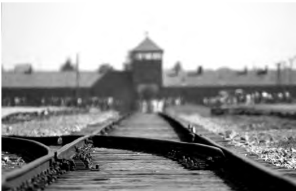
Gatehouse Auschwitz II (Birkenau)

„Auschwitz“ steht heute synonym für den Massenmord der Nationalsozialisten an Millionen von Menschen. Am 27. Januar 1945 hatten Soldaten der Roten Armee die Überlebenden des Konzentrations- und Vernichtungslagers Auschwitz-Birkenau befreit. Am 80. Jahrestag der Befreiung laden die Jüdische Kultusgemeinde Trier und der rheinland-pfälzische Landesverband Deutscher Sinti und Roma zur Gedenkstunde an die Opfer des Nationalsozialismus in das Kurfürstliche Palais in Trier ein.