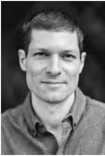
Ronen Steinke

Parlament, Regierung und geladene Gäste kommen zur zentralen Gedenksitzung des Landes in der Neuen Synagoge in Mainz zusammen. Im Mittelpunkt der Gedenkveranstaltung aus Anlass des 80. Jahrestags der Befreiung des Konzentrationslagers Auschwitz am 27. Januar 1945 stehen in diesem Jahr die von den Nationalsozialisten verfolgten Jüdinnen und Juden Europas. Neben Landtagspräsident Hendrik Hering