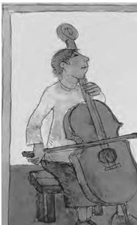
Cellistin von Auschwitz

ORT: Ehemalige Synagoge Niederzissen, Mittelstr. 30, 56651 Niederzissen