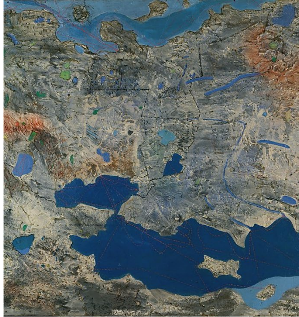
Tizian, Raub der Europa , 1559/62 / Max Ernst, Europa nach dem Regen , 1933