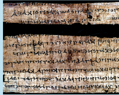
Ein Papyrus aus der Trierer Sammlung (2. Jh. v. Chr.)

Die Papyrologie beschäftigt sich mit der Erforschung lateinischer und griechischer Texte, die auf Papyri, Scherben, Pergament oder sogar auf hölzernen Schreibräfen überliefert sind! Diese Texte stammen hauptsächlich aus Ägypten, doch wir arbeiten auch mit solchen aus Syrien, Judäa, Kreta, Tunesien oder Italien. Die sprachliche Aufarbeitung sowie die historische Auswertung der Texte sind die beiden Hauptaufgaben der Papyrologie.