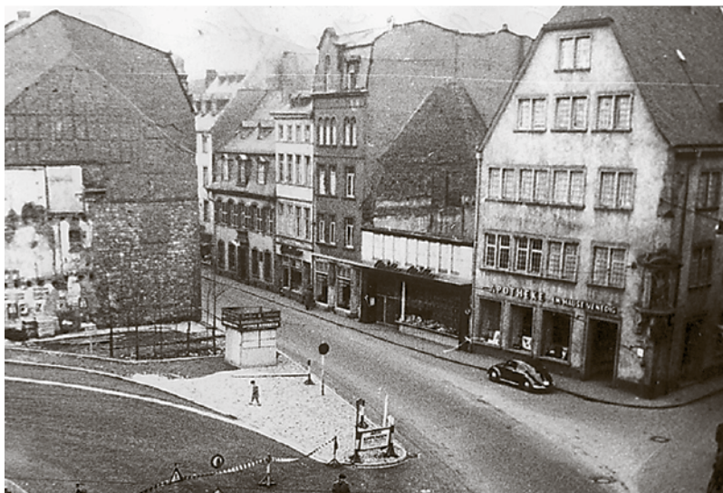
Das Bild zeigt die Ecke Stremmann-/Brücken- und Johannisstraße aus Richtung Nagelstraße. Am Gebäude links sind noch die Reste eines abgerissenen Hauses zu sehen.

Weitere Bilder und Informationen unter volksfreund.de/fotos