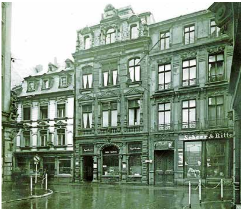
Diese Häuser in der Brotstraße wurden abgerissen. Zur Orientierung: Am linken Bildrand ist die Figur des Heiligen Johannes am Gebäude Bekleidung C. H. Feiner zu sehen. Heute befindet sich dort das Bekleidungsgeschäft „Zur Blauen Hand“.