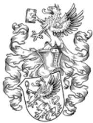
Nikolaus Koch Stiftung