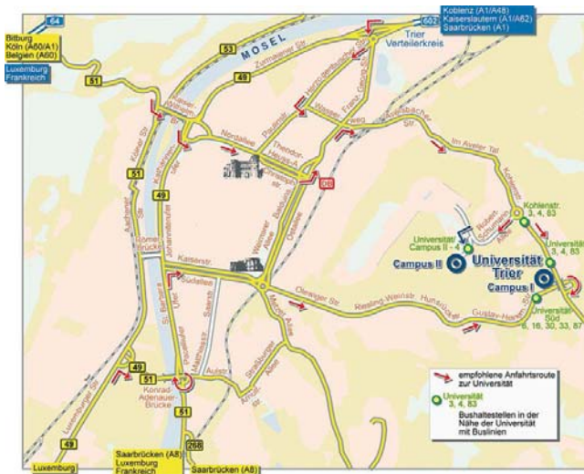
(Anfahrt zur Universität)