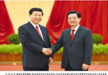
11月16日，国家主席胡锦涛、国家副主席李长春、中央书记处书记刘云山、中央政治局常委王沪宁、中央书记处书记李源潮、中央书记处书记王沪宁、中央书记处书记李源潮等同志，在北京人民大会堂亲切会见出席党的十八大代表、特邀代表和列席人员，并发表重要讲话。

2012年11月16日 星期五 第13558号 今日出版 胡锦涛习近平等领导同志亲切会见出席党的十八大代表、特邀代表和列席人员并发表重要讲话