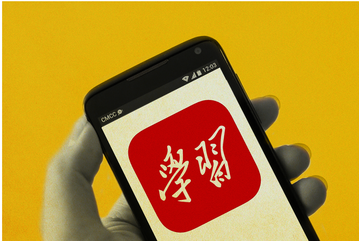
Xi Jinpings kleine rote App „学习强国“