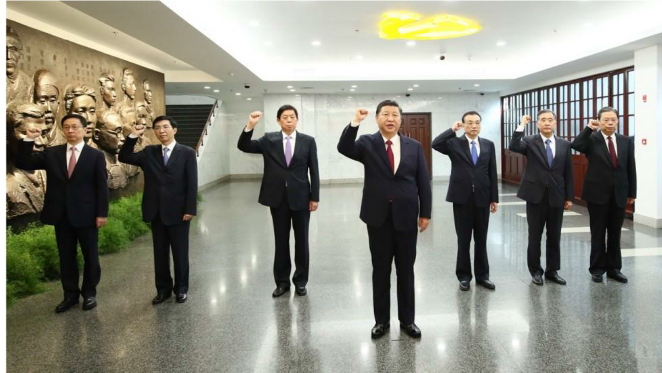
Der Ständige Ausschuss des Politbüros im November 2012 im Nationalen Geschichtsmuseum (links) und im Oktober 2017 an der Gründungsstätte der KPCh (rechts)