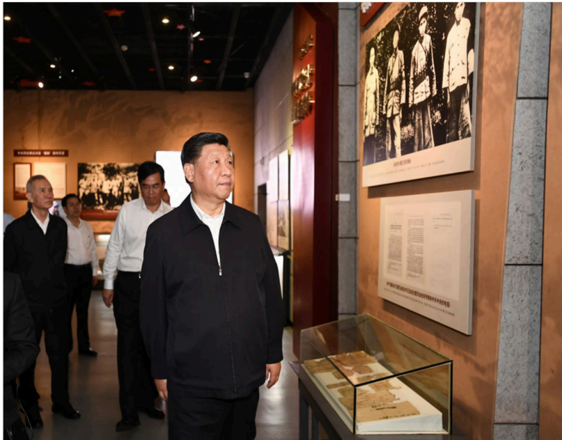
President Xi Jinping visits a museum marking the start of the Red Army's Long March on Monday in Yudu county, Ganzhou, Jiangxi province.