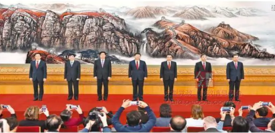
10月19日，中国共产党第十九次全国代表大会第一次全体会议在人民大会堂举行，习近平、李克强、栗战书、汪洋、王沪宁、赵乐际、韩正等同志当选为中央政治局常委。

新华社北京10月25日电 中国共产党第十九次全国代表大会第一次全体会议25日上午在人民大会堂举行。习近平同志主持会议并作重要讲话。李克强、栗战书、汪洋、王沪宁、赵乐际、韩正等同志当选为中央政治局常委。 习近平同志在讲话中，回顾党的十八大以来党和国家事业取得的历史性成就、发生的历史性变革，深刻总结过去五年来的宝贵经验，对做好新时代党和国家工作提出了明确要求。他强调，中国特色社会主义进入新时代，我国社会主要矛盾已经转化为人民日益增长的美好生活需要和不平衡不充分的发展之间的矛盾。全党同志要不忘初心、牢记使命，继续奋斗，为决胜全面建成小康社会、夺取新时代中国特色社会主义伟大胜利、实现中华民族伟大复兴的中国梦而不懈奋斗。