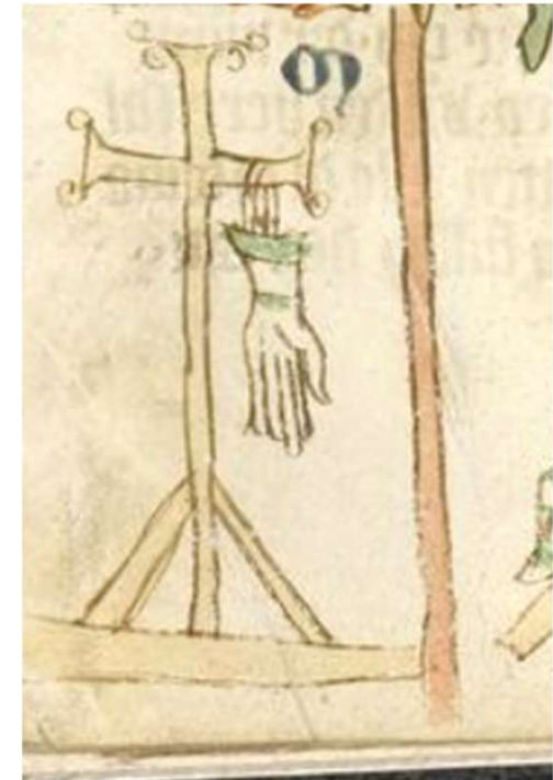
Heidelberger Sachsenspiegel, Cod. Pal. germ. 164, fol. 23r