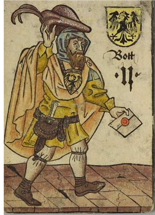
Briefbote aus dem „Hofämterspiel“, um 1455