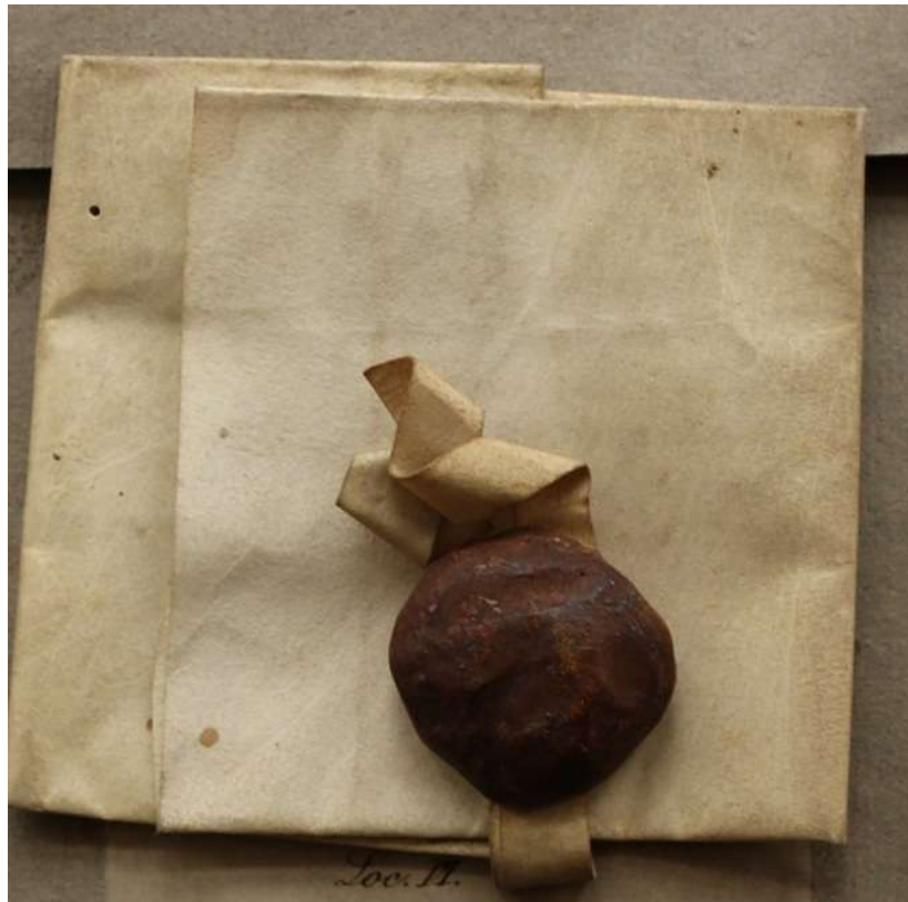
Gefaltete Urkunde, „Brief“