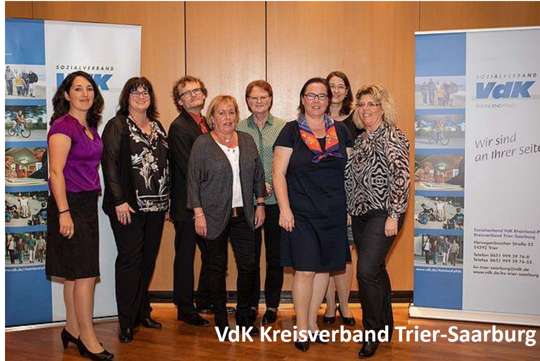
VdK Kreisverband Trier-Saarburg