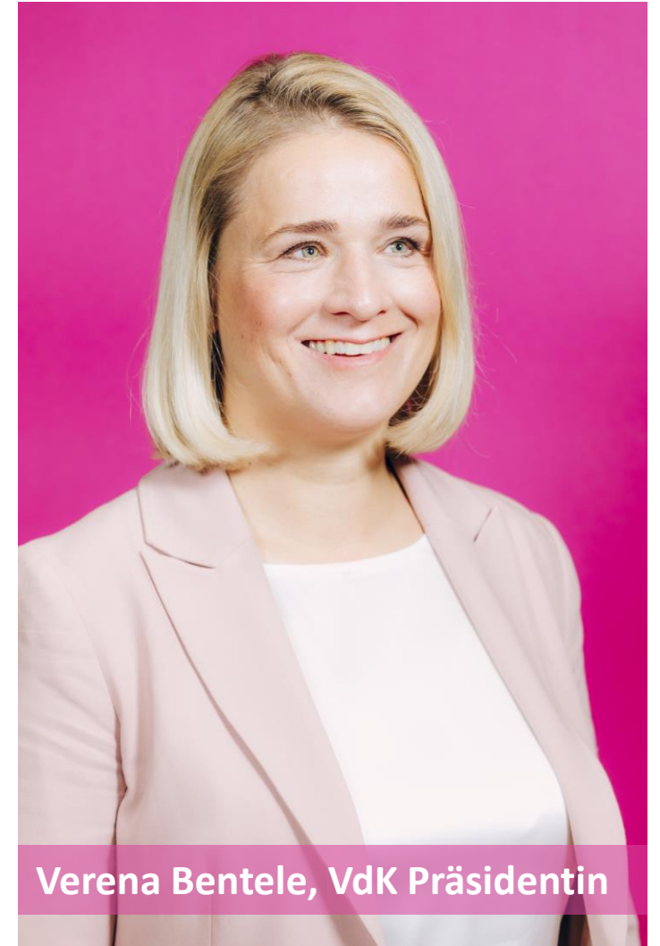
Verena Bentele, VdK Präsidentin