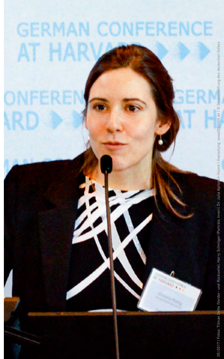
05/2017 | Gestaltung: avepDESIGN.de | © Studienstiftung des deutschen Volkes

Absolventen der Harvard Kennedy School bekommen Zugang zu einem globalen Netzwerk. Sie sind in führenden Positionen bei Regierungen, internationalen Organisationen, Think-Tanks sowie in der Wissenschaft oder Privatwirtschaft tätig. Was sie verbindet, ist das Bestreben, für den internationalen Dialog und die Veränderung der Gesellschaft einzutreten.